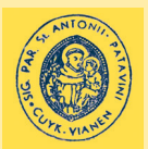
H. Antonius van Padua - Vianen